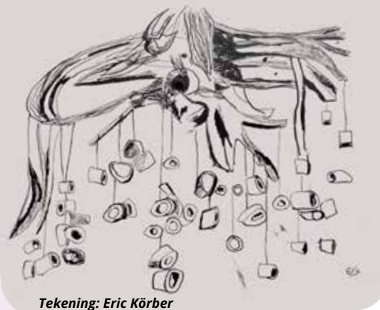
Tekening: Eric Körber

De Beenderboom is ook een beeld dat in het Vrouwenbos te vinden is. Het is een boom van beenderen, die zijn verzameld als restjes van een bouillon die in een van de keukens van De Grote Beek is gemaakt. Prikkel jouw waarnemingen, beweeg de beenderen, luister naar wat er komt. Gaan je gedachten naar de groentesoep van moeder, of hoor je de stilte? Het geluid dat je zelf maakt? Geef en neem de ruimte.