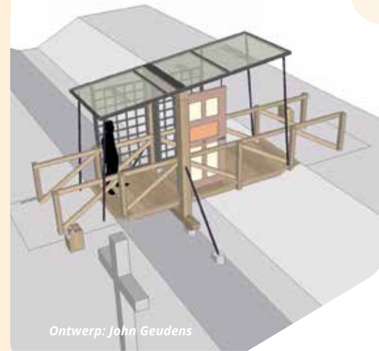
Ontwerp: John Geudens

inzichten op andere werkvormen. Zoveel mogelijk zonder dwang en drang, met stimuleren van eigen keuzen en herkenbaar in werkvormen waarin het gesprek en eigen ontwikkeling leidend is. Door deze deuren, tussen verleden en toekomst, gaat de bezoeker naar een nieuwe tijd, waarin (stimuleren van) mentale gezondheid een groot goed is. Met het lopen van het pad begint op deze plek wellicht een "blokje omdenken" door stil te staan en naar de begraafplaats te kijken en (terug-) te denken.